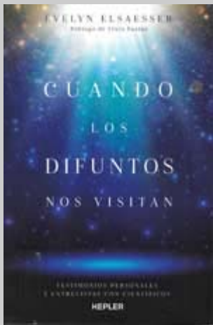
Quando los difuntos nos visitan: Testimonios personales y entrevistas con científicos.